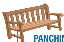
PANCHINA AL PARCO

1: Nessuna intimità / 2: Intimità da amici / 3: Poca intimità 4: Molta intimità / 5: Totale intimità (da amanti)