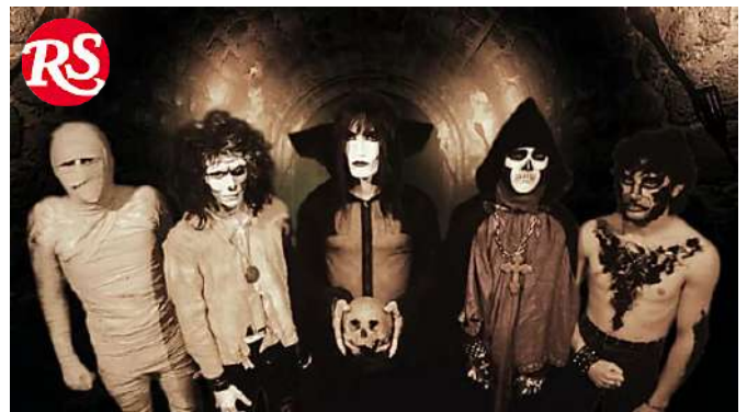
I Death SS e la discesa negli inferi della provincia italiana