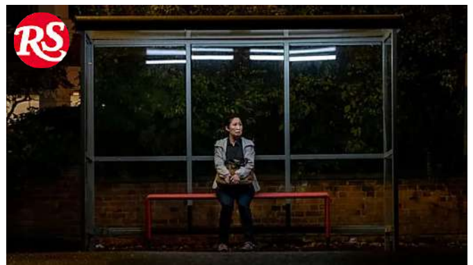
Lunga vita a 'Killing Eve', anche se (forse) è diventata un po' troppo sana di mente