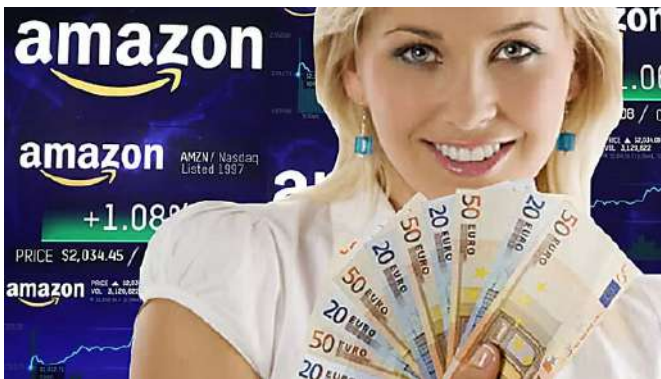
Investire Online su Amazon? Si può Iniziare con soli 200€! Scopri come! sponsor - Vici Marketing