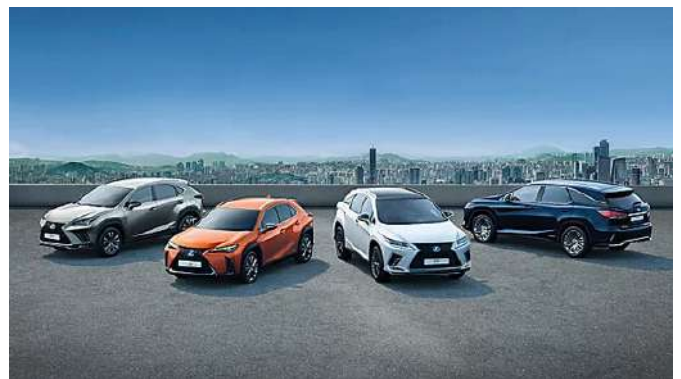
GAMMA LEXUS ELECTRIFIED. #ripartiamoinsieme. Scopri di più. sponsor - Lexus.It